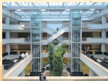
Le campus Bio-Medico : valeurs chrétiennes, professionnalisme et dignité de la personne dans une Université consacrée à la santé, au service et à la recherche clinique

Les responsables de ces projets invitent cordialement nos lecteurs à leur rendre visite sur place.