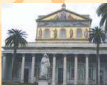
▲ Saint Paul Hors les Murs, en cette année jubilaire.

L'association des Amis de Josémaria propose aux lecteurs et amis de Tous les Chemins , la possibilité de séjourner trois jours dans la ville éternelle "guidés" par saint Josémaria.