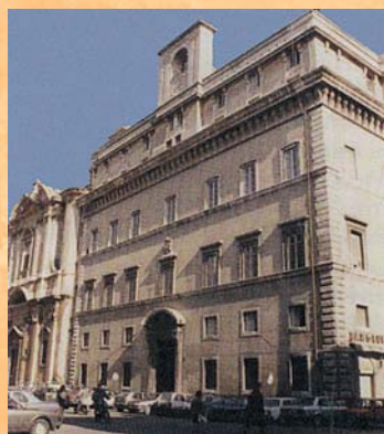
L'Université pontificale de la Sainte Croix fruit de la sollicitude de saint Josémaria pour les prêtres