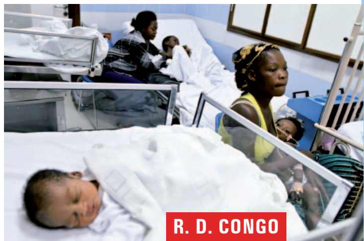
R. D. CONGO

Un contributo di 6.000 euro è stato accordato alla Diocesi di Kitui a supporto di un programma per il miglioramento delle capacità di apprendimento dei bambini di aree emarginate, con particolare attenzione a quelli affetti da disabilità.